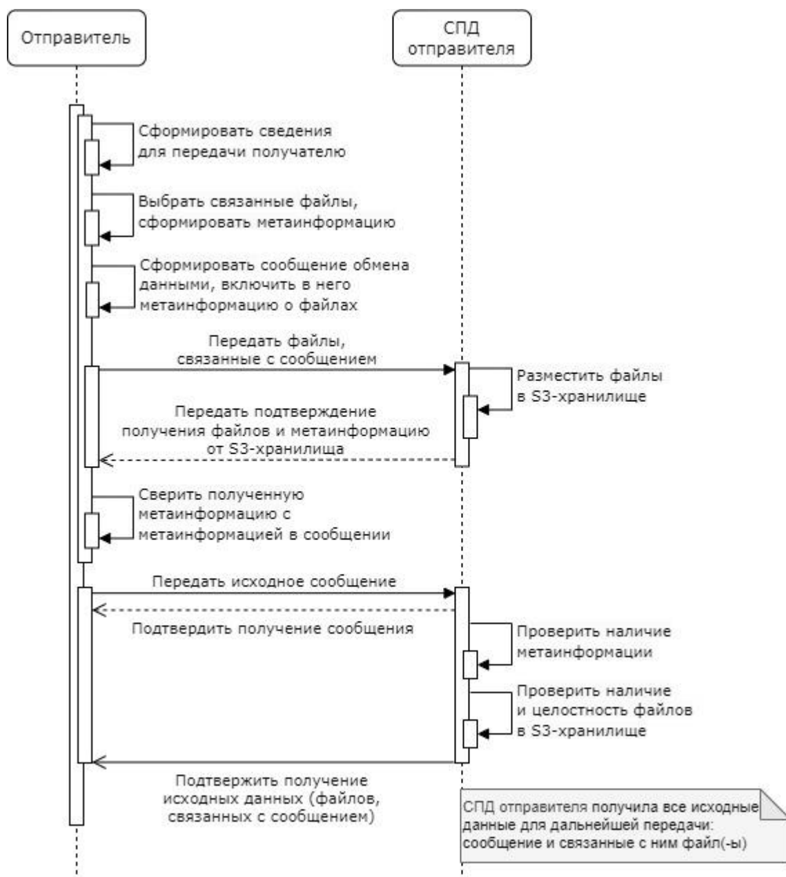
Рисунок 2 – Передача сообщения и связанных с ним файлов

17. Система передачи данных отправителя выполняет следующие действия: