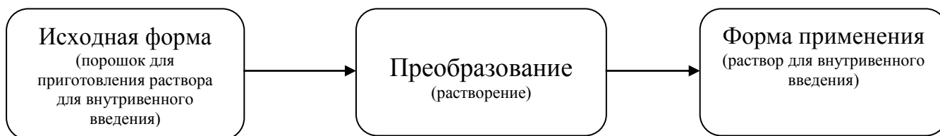
Рис.2 – Взаимосвязь между исходной формой и формой применения для лекарственных форм, требующих преобразований перед введением

Распространенным дополнительным элементом наименования лекарственной формы является признак готовности к применению . Данный элемент используется в случаях, когда лекарственная форма, в которой выпускается лекарственный препарат (исходная форма), отличается от лекарственной формы, в которой он непосредственно применяется (форма применения). То есть лекарственная форма требует проведения потребителем или медицинским персоналом дополнительного преобразования (например, растворения, разведения, диспергирования) с целью получения конечной лекарственной формы, пригодной для непосредственного введения пациенту (рис. 2).