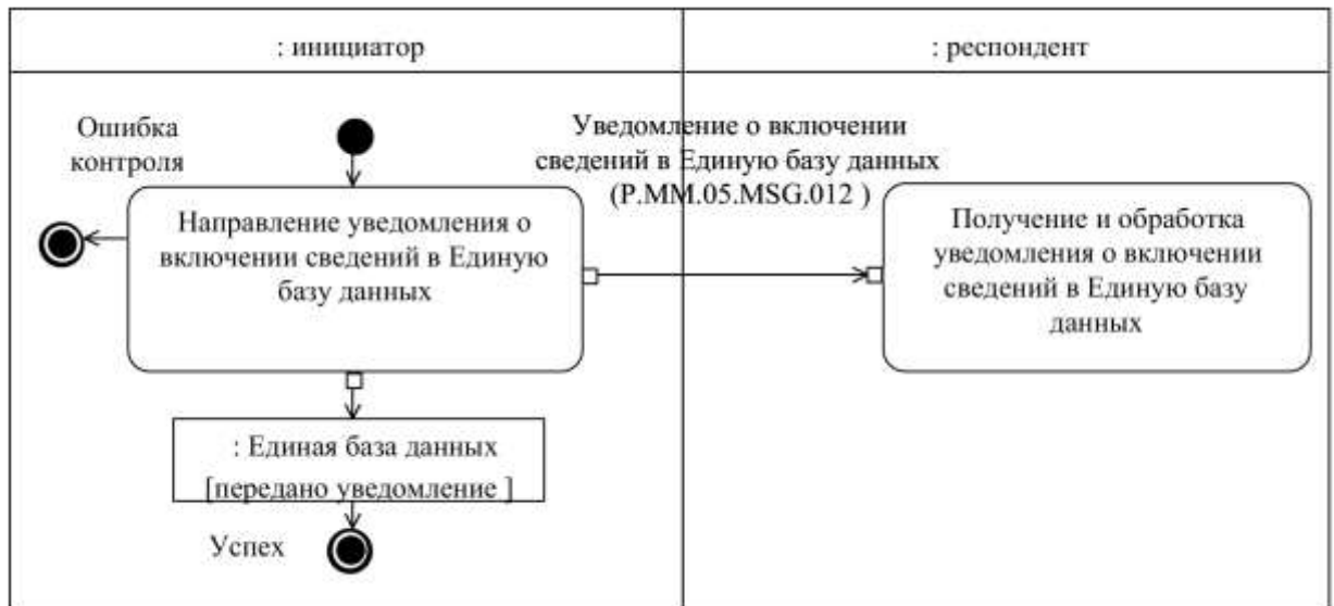
Рис. 3. Схема выполнения транзакции общего процесса «Уведомление о включении сведений из Единой базы данных» (P.MM.05.TRN.007)