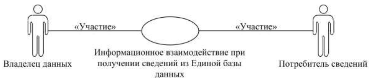
Рис. 1. Структура информационного взаимодействия между уполномоченными органами государств-членов

Структура информационного взаимодействия между уполномоченными органами государств-членов представлена на рисунке 1.