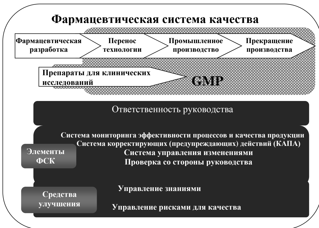
СХЕМА модели фармацевтической системы качества в соответствии с настоящим документом

На представленной схеме показаны основные особенности модели фармацевтической системы качества (ФСК). Фармацевтическая система качества охватывает весь жизненный цикл продукции, включая фармацевтическую разработку, перенос технологии, промышленное производство и прекращение производства, как показано в верхней части схемы. Фармацевтическая система качества расширяет требования настоящих Правил, как показано на схеме. Схема также показывает то, что требования настоящих Правил распространяются на