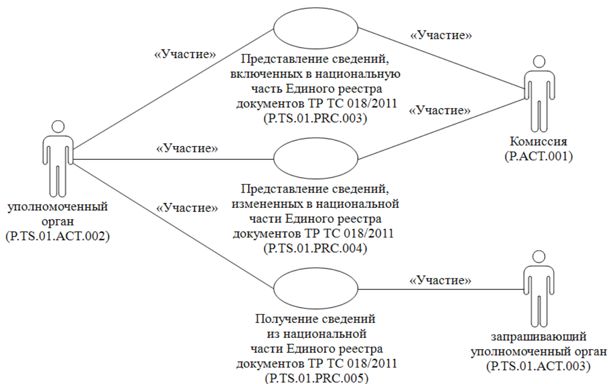
Рис. 1. Структура общего процесса

12. Приведенное описание структуры общего процесса представлено на рисунке 1.