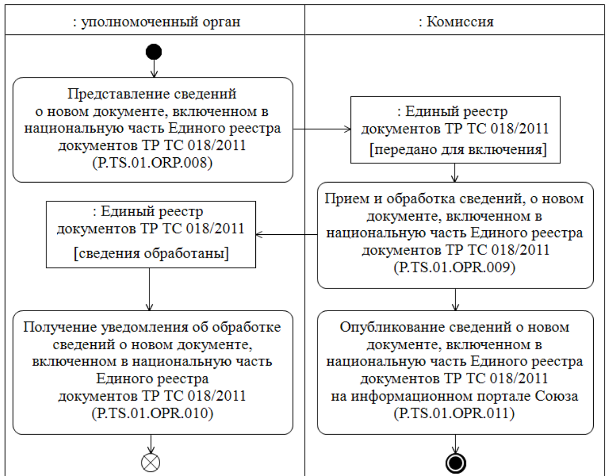
Рис. 2. Схема выполнения процедуры «Представление сведений, включенных в национальную часть Единого реестра документов ТР ТС 018/2011» (P.TS.01.PRC.003)

19. Схема выполнения процедуры «Представление сведений, включенных в национальную часть Единого реестра документов ТР ТС 018/2011» (P.TS.01.PRC.003) представлена на рисунке 2.