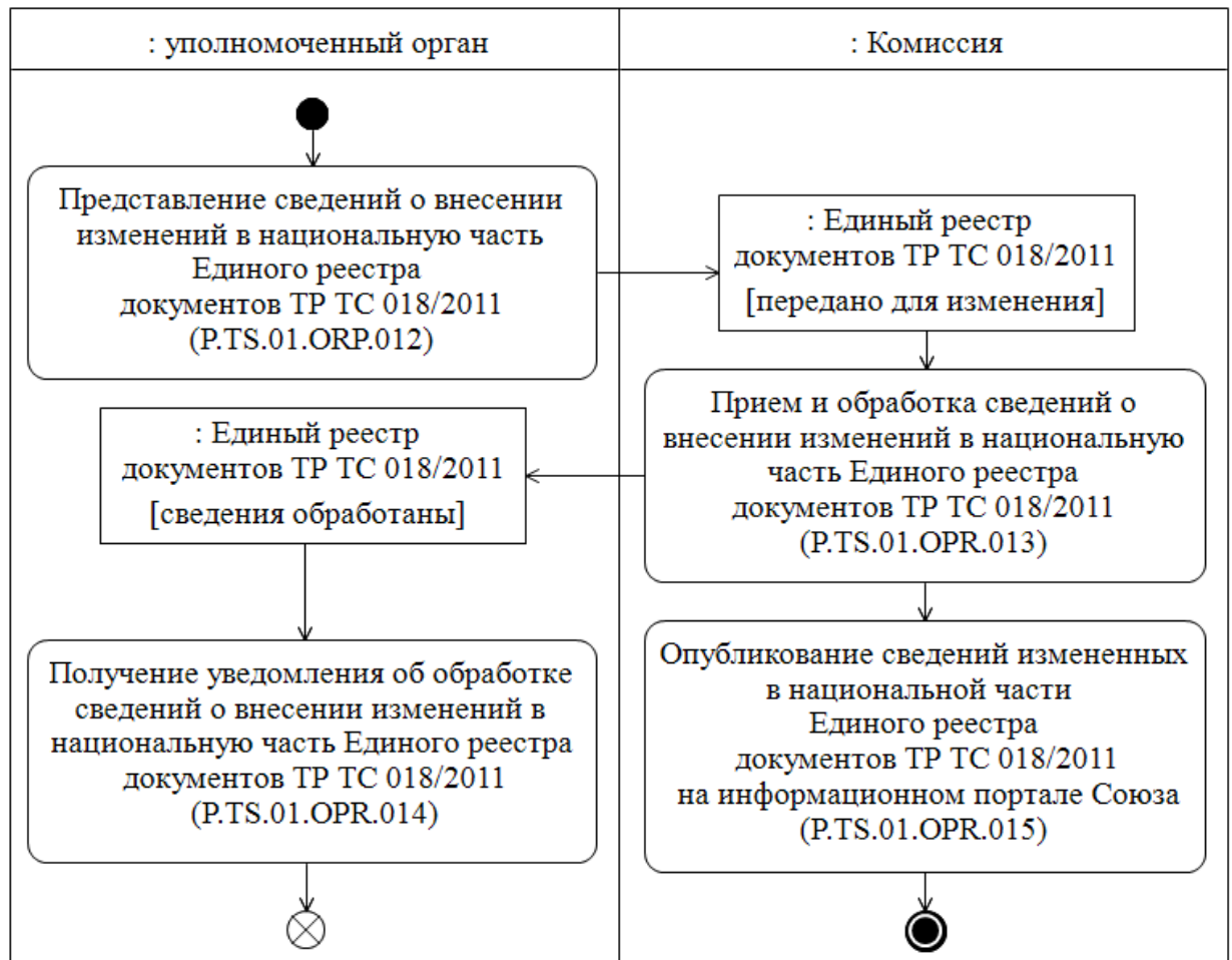
Рис. 3. Схема выполнения процедуры «Представление сведений, измененных в национальной части Единого реестра документов ТР ТС 018/2011» (P.TS.01.PRC.004)

28. Процедура «Представление сведений, измененных в национальной части Единого реестра документов ТР ТС 018/2011» (P.TS.01.PRC.004) выполняется уполномоченным органом при изменении сведений о документе об оценке соответствия в национальной части Единого реестра документов ТР ТС 018/2011.